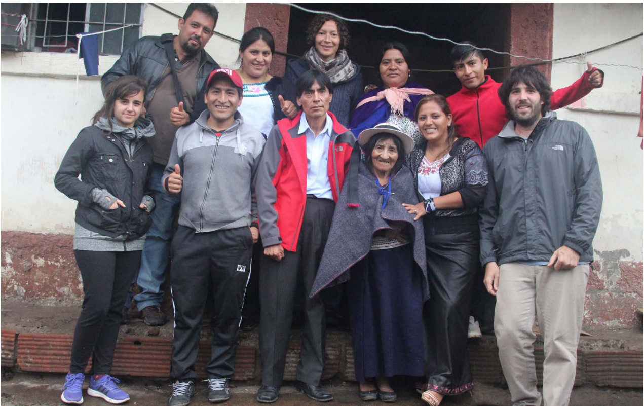
Miembros de la Comunidad Pulucate en Riobamba, junto a equipo de trabajo de la UArtes.